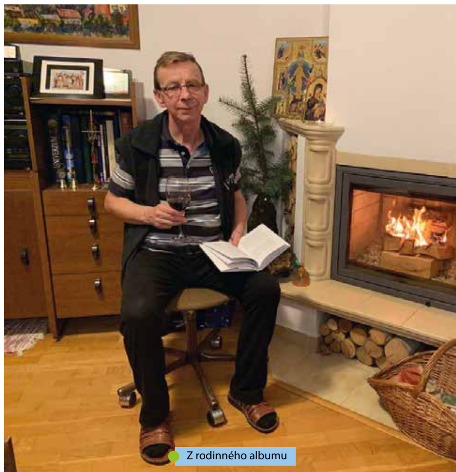
● Z rodinného albumu