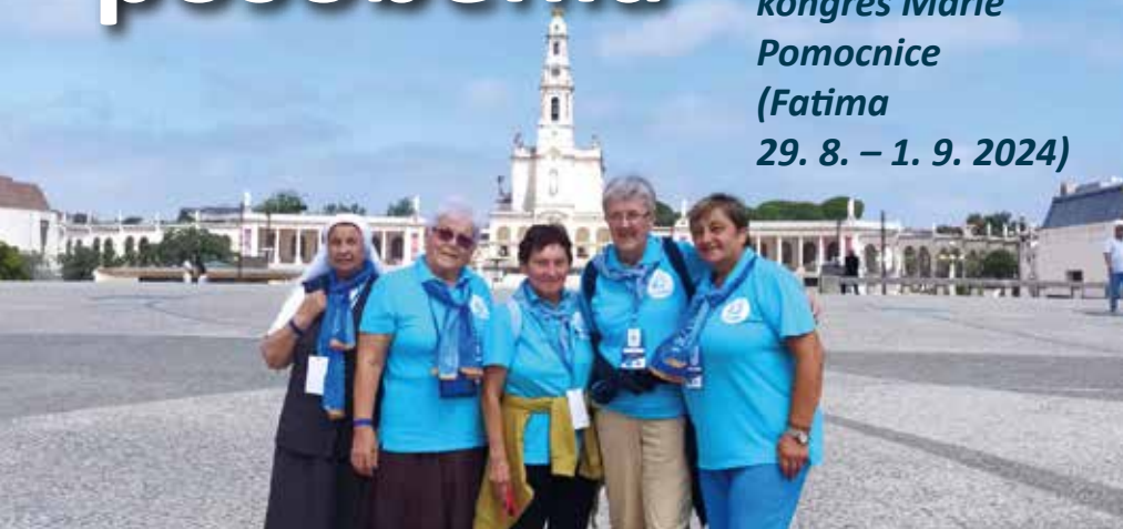
Autor: Magdaléna Straková ADMA

IX. medzinárodný kongres Márie Pomocnice (Fatima) 29. 8. – 1. 9. 2024)