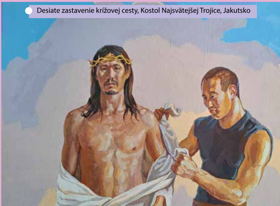
Desiate zastavenie krížovej cesty, Kostol Najsvätejšej Trojice, Jakutsko