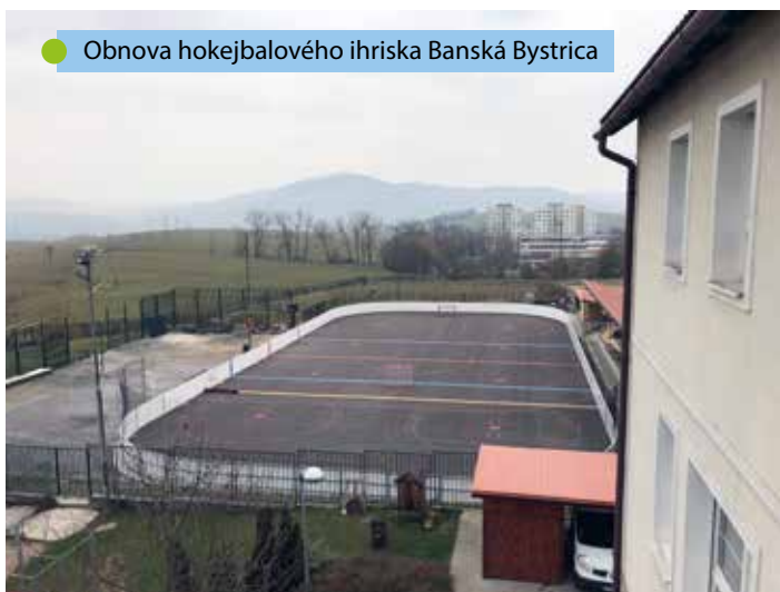
● Obnova hokejbalového ihriska Banská Bystrica