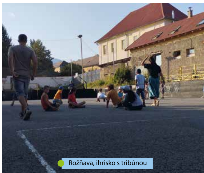
● Rožňava, ihrisko s tribúnou

Bol veľmi konkrétny a jasný. Len sprostredkované som sa dozvedel o jeho štedrosti aj pre iné saleziánske strediská, o darovaných autách, pomoci na Ukrajinu a iné.