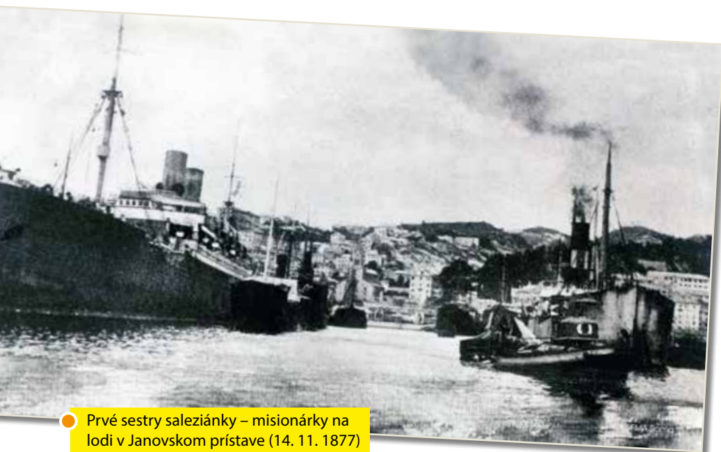
Prvé sestry saleziánky – misionárky na lodi v Janovskom prístave (14. 11. 1877)