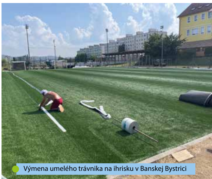
● Výmena umelého trávniku na ihrisku v Banskej Bystrici