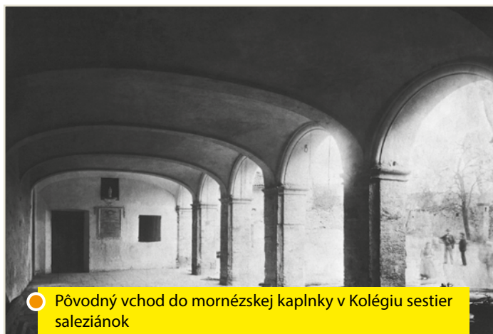
Pôvodný vchod do mornézskej kaplnky v Kolégiu sestier saleziánok