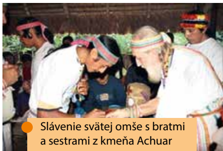
Slávenie svätej omše s bratmi a sestrami z kmeňa Achuar

Zomrel 6. februára 2013 v Lime. 27. septembra 2021 sa začal proces jeho blahorečenia.